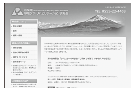
山梨県呼吸ケア・リハビリテーション研究会