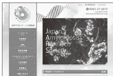
日本アミロイドーシス研究会